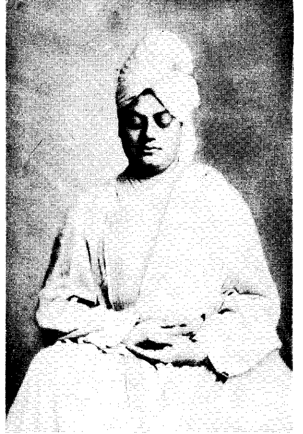
श्री स्वामी विवेकानन्द जी महाराज